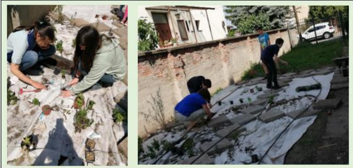
Ültetés és a locsolórendszer kialakítása